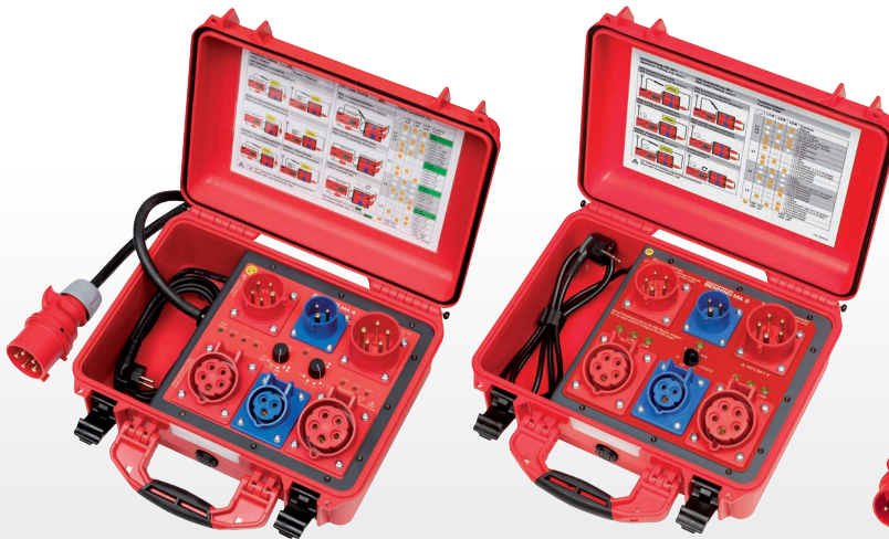
BENNING MA 4 (044162)

Für die Ableit- und Laststrommessung sind Zwischenadapter erforderlich.