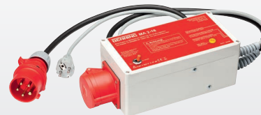
BENNING MA 2-16 (044160)