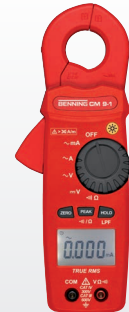
BENNING CM 9-1 (044682)