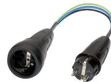
Messadapter (044131) z.B. für CM 9-1